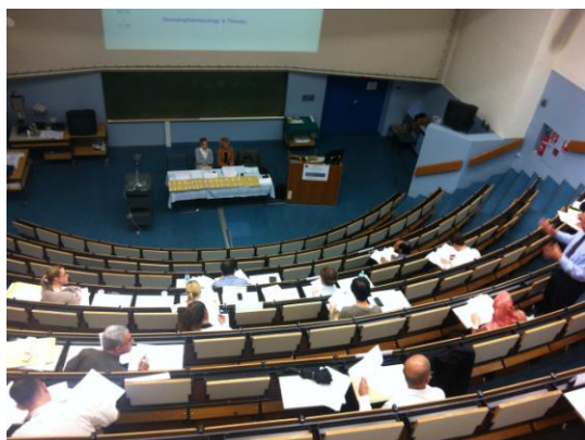
Pohled do části posluchárny při evropské atestaci z dermatovenerologie